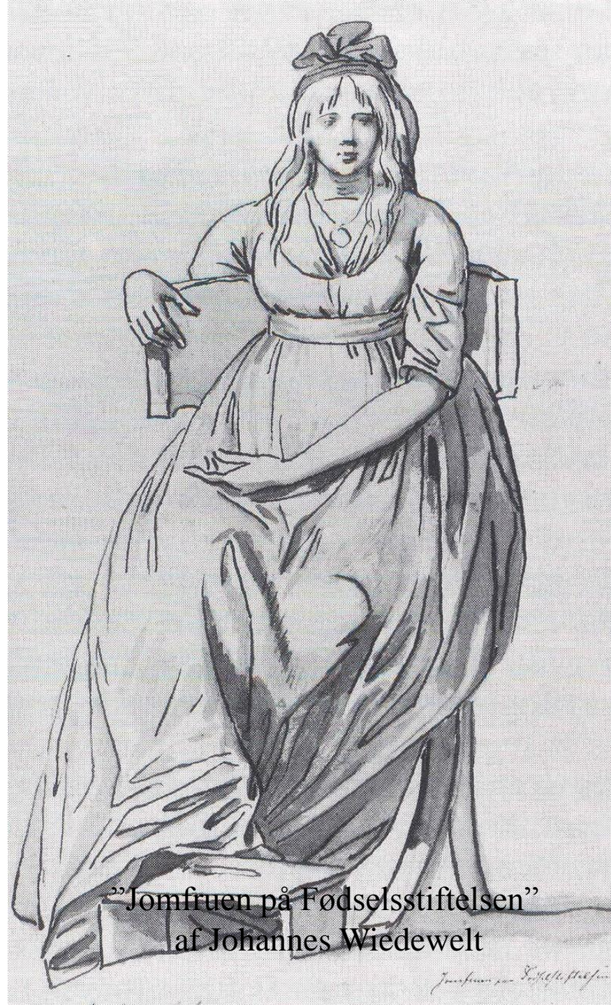
”Jomfruen på Fødselsstiftelsen” af Johannes Wiedewelt